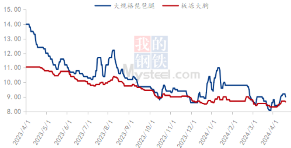
(2023年-2024年) 全国大规格琵琶腿、板冻大胸价格走势图 (元/公斤)