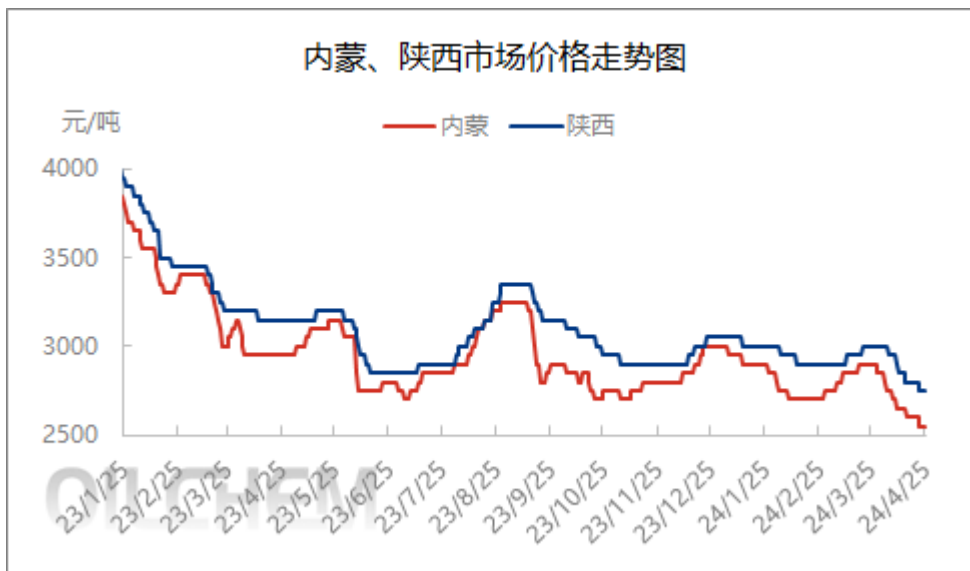
图表 7 2023-2024 年内蒙、陕西地区电石价格走势

本周国内电石市场于低位继续下探，乌海地区主流贸易价格在 2550 元/吨，生产企业出货积极，成交灵活。随着电石价格的下调，生产企业的亏损压力增加，近期兰炭价格出现上涨，在亏损压力下月底停炉装置陆续增多，电石供应走弱趋势明显。下游目前待卸车高位，五一小长假即将到来，各企业备货积极，但待卸车高位，也导致物流循环受限。下周受供电线路检修及计划性检修影响，电石开工预计呈现下降趋势，下周预计低位货源陆续减少，企业出货逐渐好转。五一期间，市场主要以场内库存消耗为主，价格筑底盘整。