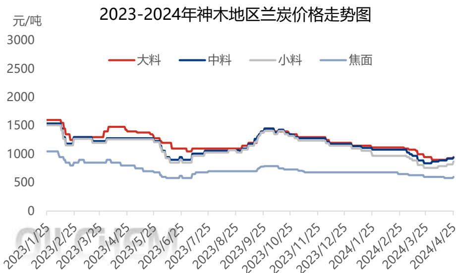
图表 5 国内区域价格变动对比表